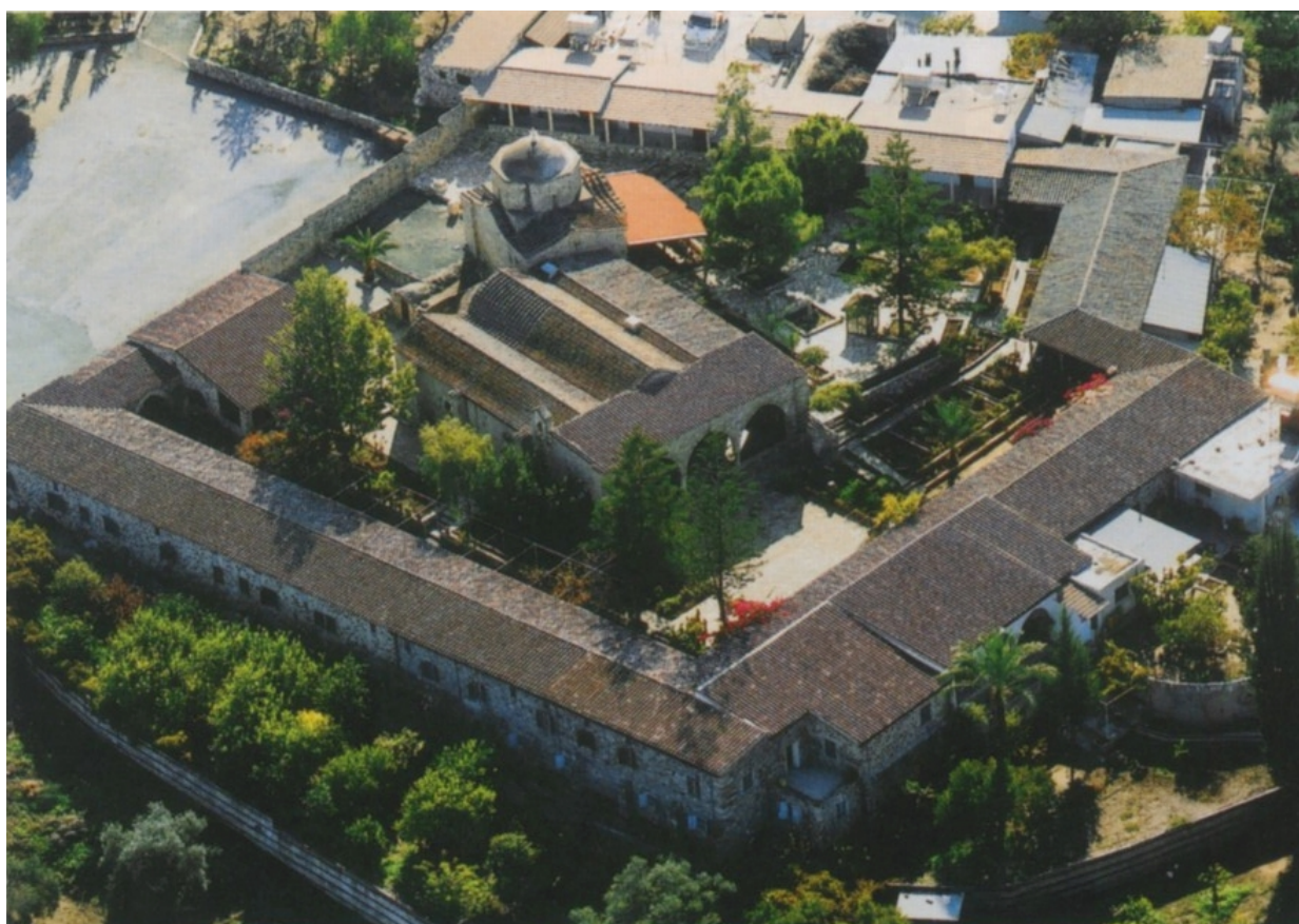
Πανοραμική άποψη, με αεροφωγραφία, της Ιεράς Μονής Αγίου Ηρακλειδίου η οποία βρίσκεται κοντά στο χωριό Πολιτικό τς Επαρχίας Λευκωσίας.

Για το σκοπό αυτό, ο Ιεροκλής έδωσε στους αποστόλους το γιο του Ηρακλείδιο. Στην πορεία, ο Ηρακλείδιος άρχισε να αναφέρει τα της ελληνικής θρησκείας, θέλοντας να αγρεύσει τους αποστόλους στην προσκύνηση των ειδώλων. Οι δε απόστολοι βλέποντας αυτόν ως «εραστήν όντα του ζωτικού λόγου» και «δοχείον καθαρώτατον» κατήχησαν το νεαρό Ηρακλείδιο στη σάρκωση και τα πάθη και την ανάσταση του Ιησού Χριστού.