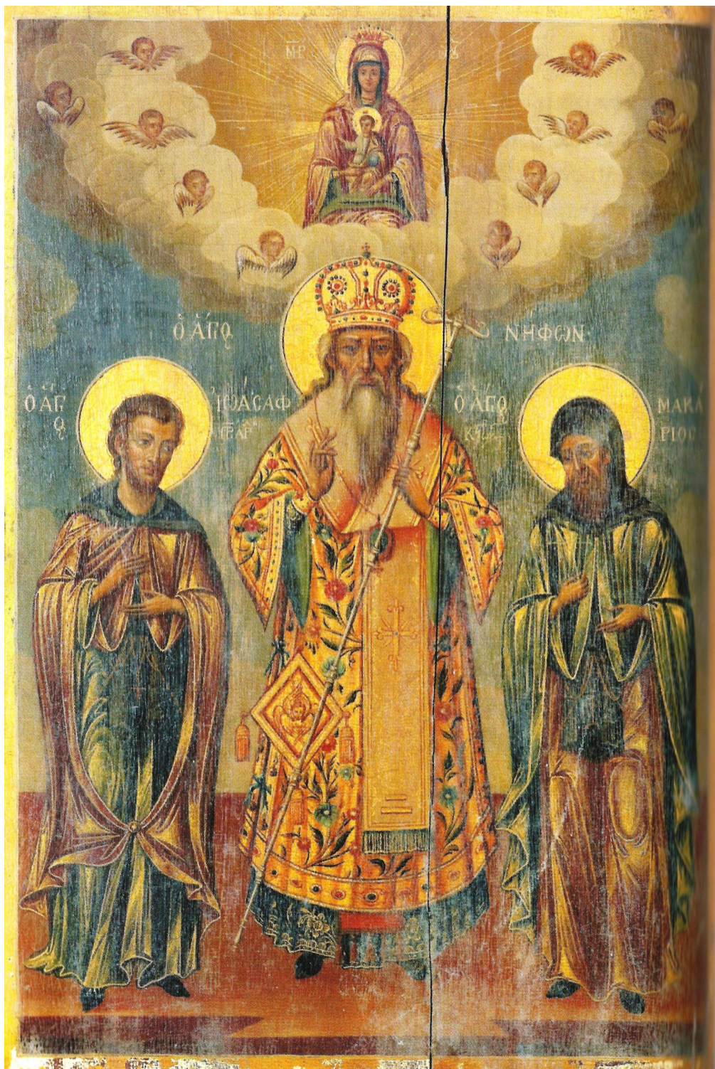
Ο άγιος Νήφων Οικουμενικός Πατριάρχης, και οι μαθητές του Ιωάσαφ και Μακάριος. Φορητή εικόνα 19ος αιώνας.

Δεν είναι γνωστός ο τόπος καταγωγής και ποιοί ήταν οι γονείς του. Υπήρξε μαθητής του αγίου Νήφωνος (+1508) Πατριάρχου Κωνσταντινουπόλεως, του οποίου τον βίο μιμήθηκε. «Φθάσας δε εις το άκρον και τέλειον της θείας αγάπης