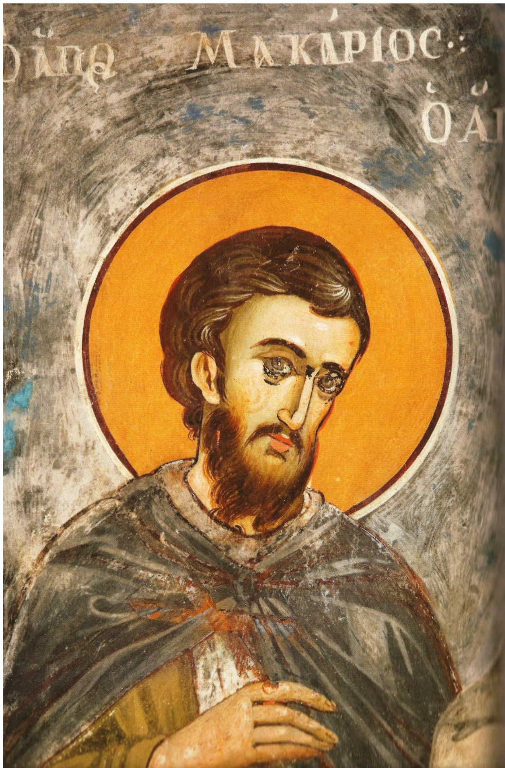
Ο άγιος Μακάριος, μαθητής αγίου Νήφωνος Κωνσταντινουπόλεως. Λεπτομέρεια τοιχογραφίας εξωνάρθηκα Κυριακού Βατοπαιδινής Σκήτης Αγίου Δημητρίου, 1806.

Η μνήμη του οσιομάρτυρος Μακαρίου, που θεωρείται και ο πρώτος Νεομάρτυς Αγιορείτης, τιμάται στις 14 Σεπτεμβρίου. Το μαρτύριό του πραγματοποιήθηκε το 1507 και όχι το 1527, όπως λανθασμένα αναφέρεται, αφού ο Γέροντάς του άγιος Νήφων εκοιμήθη το 1508.