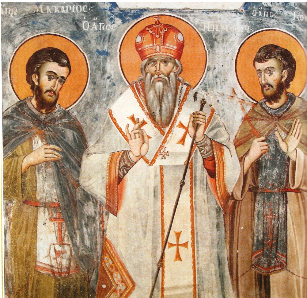
Ο άγιος Νήφων Κωνσταντινουπόλεως και οι μαθητές του Μακάριος και Ιωάσαφ. Τοιχογραφία εξωνάρθηκα Κυριακού Σκήτης Αγίου Δημητρίου, 1806.

εφλέγετο καθ' εκάστην η καρδιά του και επόθει να αξιωθή να τελειώση την ζωήν του με μαρτυρικόν θάνατον». Φανέρωσε τον ένθεο πόθο του στον άγιο διδάσκαλό του, που βρισκόταν τότε πάλι στην ιερά μονή Βατοπαιδίου, και αφού γνώρισε ότι η επιθυμία του είναι πράγματι κατά θεία βούληση, τον νουθέτησε κα-τάλληλα, του ευχήθηκε, τον ευλόγησε, τον κατεφίλησε και τον κατευόδωσε προς την οδό του μαρτυρίου και του είπε: «Άπελθε, τέκνον, εις την οδόν του μαρτυρίου, ότι κατά την προθυμίαν σου, θέλεις αξιωθή να λάβης τον στέφανον της αθλήσεως και να αγάλλεσαι αιωνίως μετά των ματύρων και των οσίων».