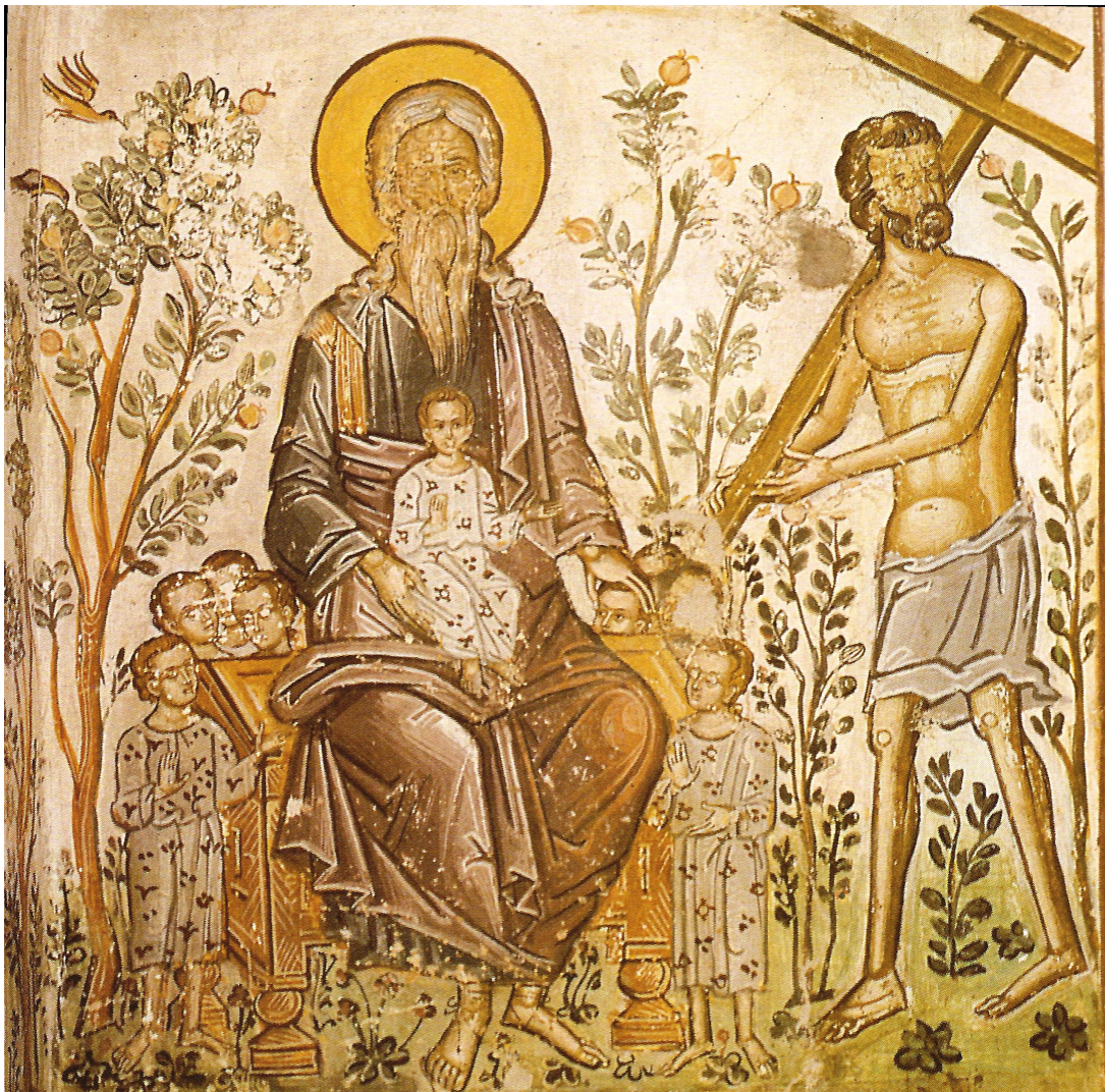
Ο ληστής στον παράδεισο. Τοιχογραφία καθολικού Ιεράς Μονής Ρουσάνου Μετεώρων.

αιώνα. Μεταξύ των ετών 1527 και 1529 οι Γιαννιώτες αδελφοί ιερομόναχοι Ιωάσαφ και Μάξιμος ανέβηκαν στον στύλο του Ρουσάνου, οπότε ανακαίνισαν και ανέκτισαν το ερειπωμένο από την φθορά του χρόνου παλαιό καθολικό της Μονής (της Μεταμόρφωσης του Σωτήρος). Η ωραία τοιχογράφηση του, κρητικής τεχνοτροπίας, έγινε στα 1560, επί ηγουμένου της Μονής Αρσενίου. Στην Μονή Ρουσάνου τιμάται με ιδιαίτερη ευλάβεια και πανηγυρίζεται με μεγάλη λαμπρότητα και μεγαλοπρέπεια η μνήμη της Μεγάλομάρτυρος Βαρβάρας (4 Δεκ.).