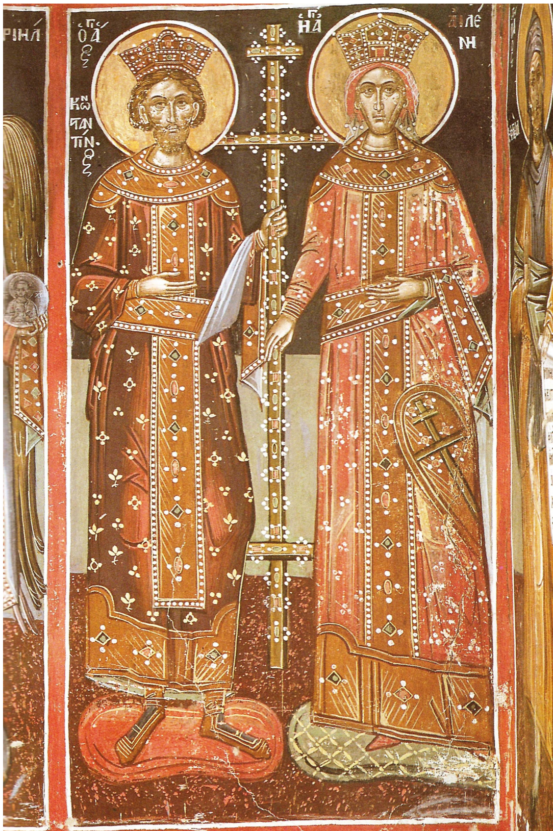
Οι ένδοξοι Θεόστυποι βασιλείς και ισαπόστολοι Κωνσταντίνος και Ελένη. Τοιχογραφία καθολικού Ι.Μ. Ρουσάνου Μετεώρων.

Στα έξι αυτά αγιομετεωρίτικα μοναστήρια, φορτωμένα με τις μνήμες του πολυτάραχου αλλά και ένδοξου βυζαντινού και νεώτερου παρελθόντος τους, μέσα στην υποβλητική σιωπή και μυστηριακή γαλήνη των κατασκευτικών και