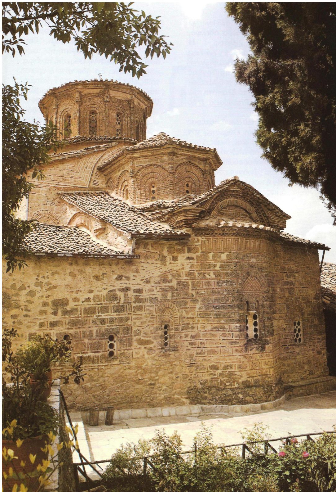
Το καθολικό της Μονής Μεγάλου Μετεώρου (Μεταμορφώσεως). Εξωτερική άποψη.

Η Μονή του Μεγάλου Μετεώρου διατηρεί επίσης, σε άριστη κατάσταση, το παλιό παραδοσιακό μαγειρείο-μαγκιπέιο, σύγχρονο με την παρακείμενη παλαιά τράπεζα (1557), ένα από τα καλύτερα αρχιτεκτονικά δείγματα του είδους του. Το παλιό μαγειρείο, πλήρως εξοπλισμένο, προσφέρει στους επισκέπτες την δυνατότητα γνωριμίας με τον παραδοσιακό τρόπο ζωής και μοναστηριακής-οίκιακής