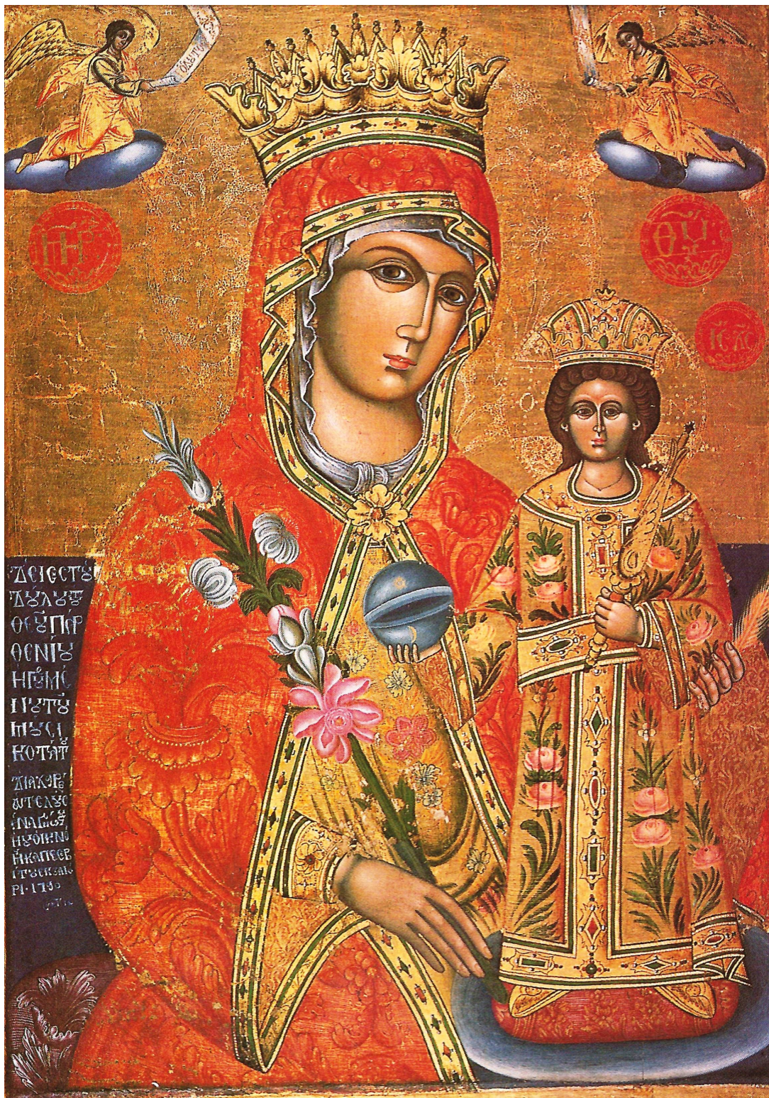
Η Παναγία με τον Χριστό. Φορητή εικόνα (έτους 1790) στο τέμπλο του κυρίως ναού του καθολικού. Είναι αφιέρωμα του ηγουμένου Παρθενίου.

Το παλαιό διώροφο νοσοκομείο-γηροκομείο της Μονής, οικοδομημένο τό 1572, από τα χαρακτηριστικότερα και ωραιότερα δείγματα μοναστηριακής αρχιτεκτονικής, είναι ένα από τα δύο μοναστηριακά νοσοκομεία πού διατηρείται ως τις μέρες μας (το δεύτερο στην Μονή Βαρλαάμ) και το μοναδικό στο είδος του διώροφο. Φιλόκαλα αναπαλαιωμένο, στερεωμένο, συντηρημένο, και ανακτισμένο στην