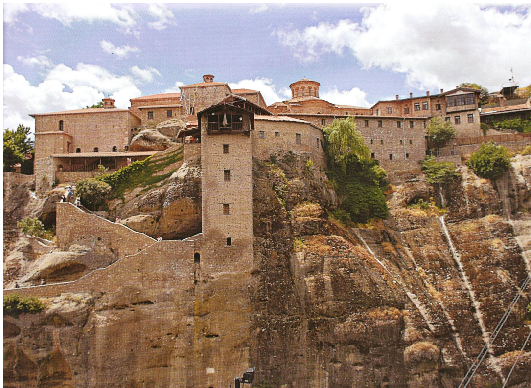
Η Ιερά Μονή Μεγάλου Μετεώρου, που η ίδρυσή της αποτελεί αφετηρία του οργανωμένου μετεωρικού μοναχισμού.

Η Μονή του Μεγάλου Μετεώρου ή της Μεταμορφώσεως του Σωτήρος ιδρύθηκε λίγο πριν από τα μέσα του ιδ΄ αιώνα από τον όσιο Αθανάσιο τον Μετεωρίτη, ο οποίος και υπήρξε ο πρώτος κτίτορας της Μονής και οργανωτής συστηματικού μοναστικού κοινοβίου. Γι΄ αυτό η ίδρυση του μοναστηριού αυτού αποτελεί σταθμό ή μάλλον αφετηρία του οργανωμένου μετεωρίτικου μοναχισμού.