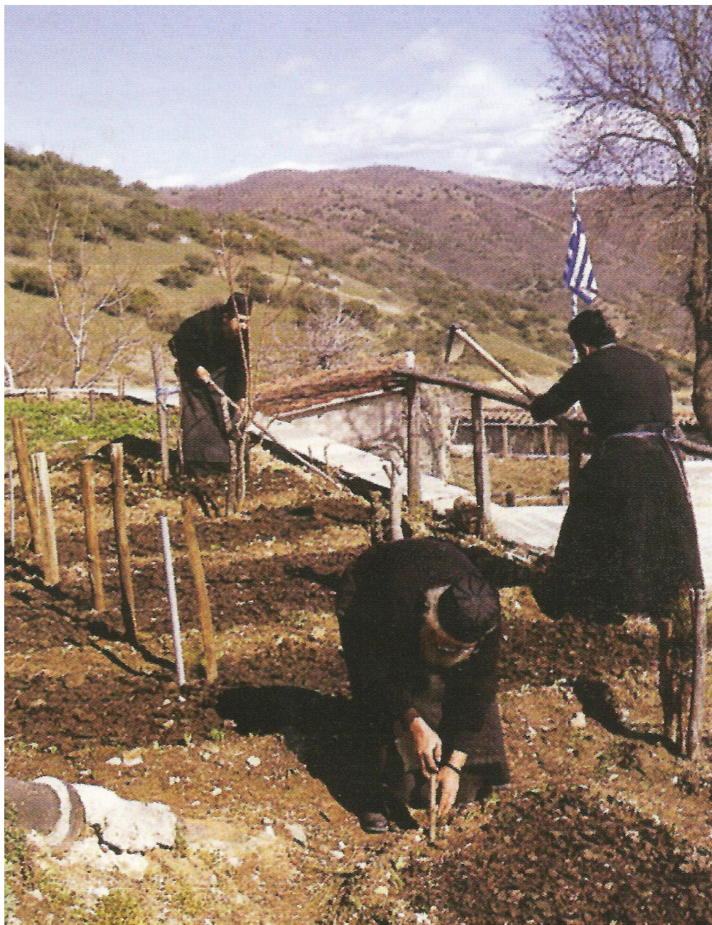
Μοναχοί φροντίζουν τον κήπο της Μονής Μεγάλου Μετεώρου.

Τον Αθανάσιο και τον Ιωάσαφ η Εκκλησία μας κατέταξε στην χορεία των οσίων της και τιμά την μνήμη τους στις 20 Απριλίου. Οι ιερές και χαριτόβρυτες κάρες των δύο κτιτόρων φυλάσσονται στην λιτή του καθολικού τής Μονής ως θησαυρός πολυτίμητος.