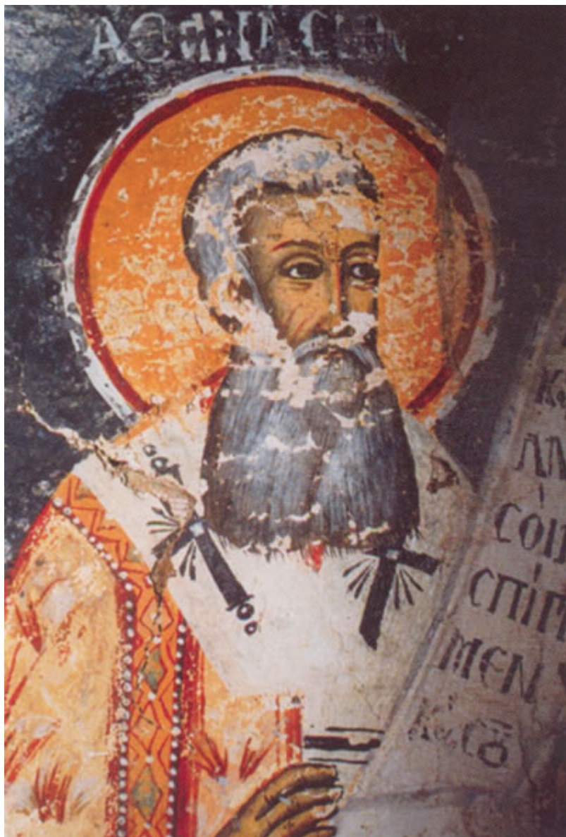
Ο άγιος Αθανάσιος. Τοιχογραφία στο παρεκκλήσι Αγίας Τριάδας, Ανήλιο Πηλίου. Έργο του Παγώνη (1804).

Η ζωγραφική στους παλαιότερους ναούς γινόταν με τη μέθοδο της νωπογραφίας, δηλαδή της ζωγραφικής σε φρεσκοσοβατισμένο τοίχο με χρώματα φυσικής προέλευσης. Η ζωγραφική φορητών εικόνων σε ξύλο γινόταν με τα ίδια χρώματα αλλά με την προσθήκη αυγού ως συνδετική ύλη. Στις νεώτερες τοιχογραφίες και στις φορητές εικόνες χρησιμοποιήθηκε η τεχνική της ελαιογραφίας.