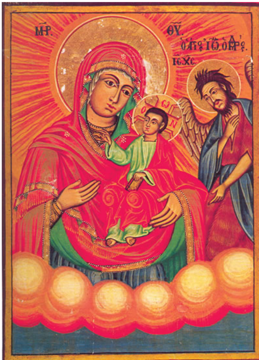
Θανάση Παγιώνη: «Μ(ήτη)Ρ Θ(εο)Υ □ Ο Ἅγιος Ιωάννης ο Πρόδρομος». 1885. Φορητή εικόνα σε σανίδι. Από τα τελευταία έργα του ζωγράφου. Μετά 1-2 χρόνια πέθανε. Κυριαρχούν τα θερμά χρώματα και περισσότερο το κόκκινο. Πηγή: «η λαϊκή τέχνη του Πηλίου», Κ.Α. Μακρή.

Η ζωγραφική αναπτύχθηκε παράλληλα με τις άλλες τέχνες, και ήταν αυτή που έκανε ευρύτερα γνωστό το χωριό. Οι Χιονιαδίτες ζωγράφοι περιφέρονταν στα χωριά της περιοχής αλλά και σε μακρινότερα μέρη της Ηπείρου, φθάνοντας μέχρι και τη Βόρειο Ήπειρο, στη Μακεδονία, το Άγιο Όρος, τη Θεσσαλία και τις γειτονικές χώρες, όπου ζωγράφιζαν ναούς και διακοσμούσαν αρχοντικές κατοικίες.