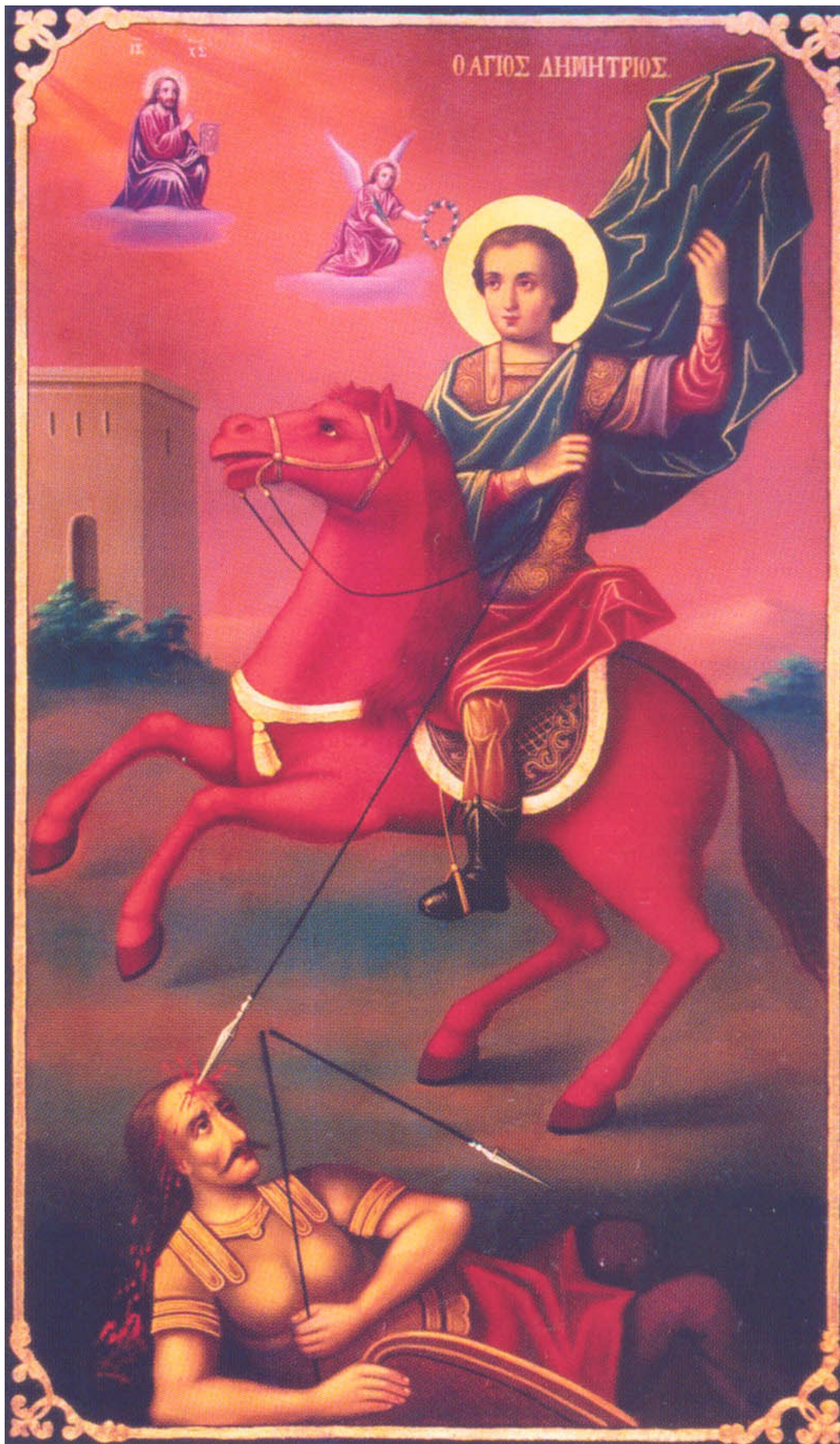
Ο άγιος Δημήτριος. Ναός Αγίας Παρασκευής - Μηλόβιστα Σκοπίων. Έργο των