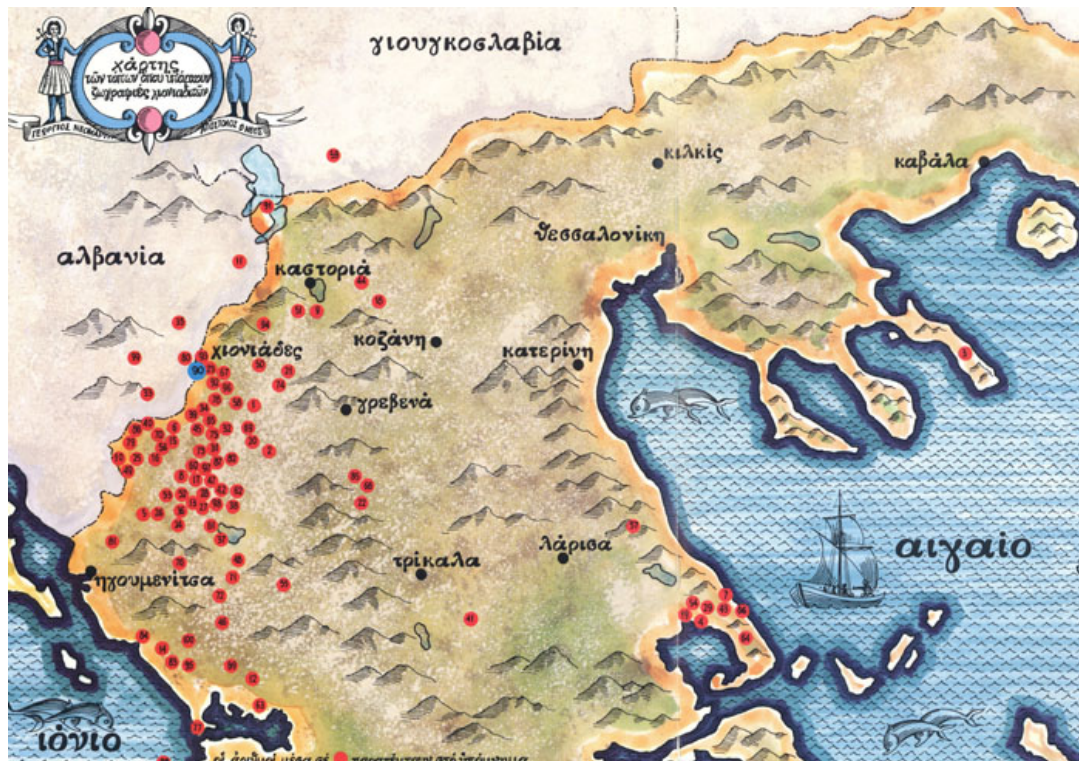
Στον χάρτη φαίνονται (με κόκκινο) οι περιοχές στις οποίες έχουν βρεθεί ζωγραφίες Χιοναδιτών ζωγράφων.