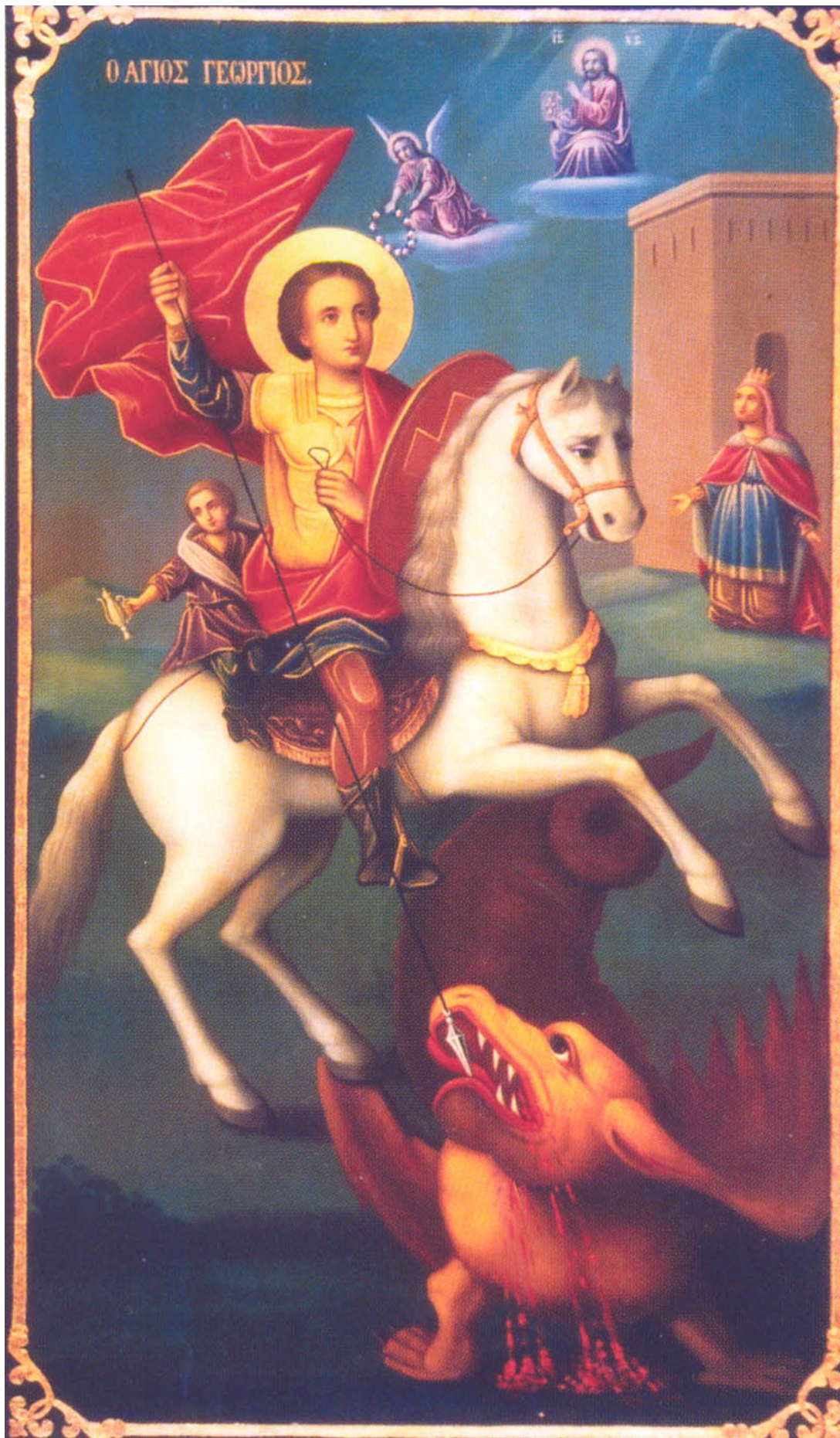
Ο άγιος Γεώργιος. Ναός Αγίας Παρασκευής - Μηλόβιστα Σκοπίων. Έργο των Χιονιαδιτών