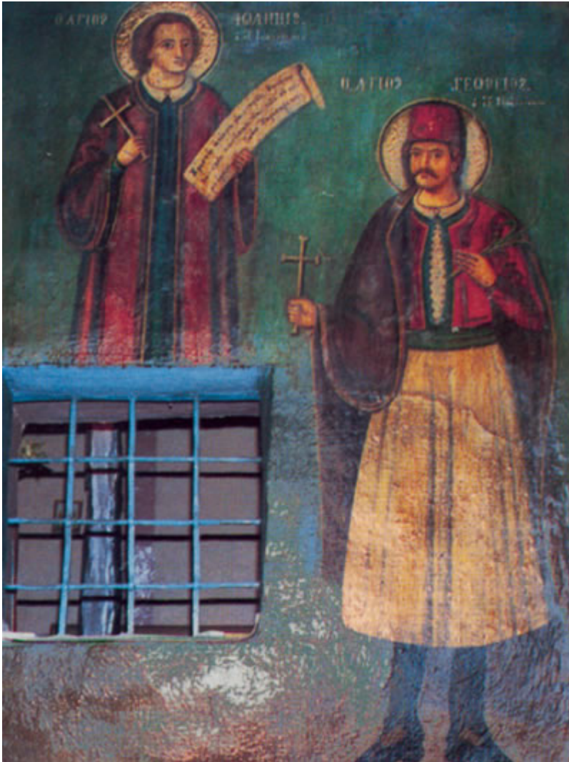
Οι άγιοι Ιωάννης και Γεώργιος οι εξ Ιωαννίνων. Τοιχογραφία του καθολικού της Μονής Αγίου Αθανασίου Δελβινακίου.

Πλήθος φορητών εικόνων υπάρχουν διάσπαρτες σε πολλούς ναούς που βρίσκονται σε πολλές περιοχές της χώρας μας.