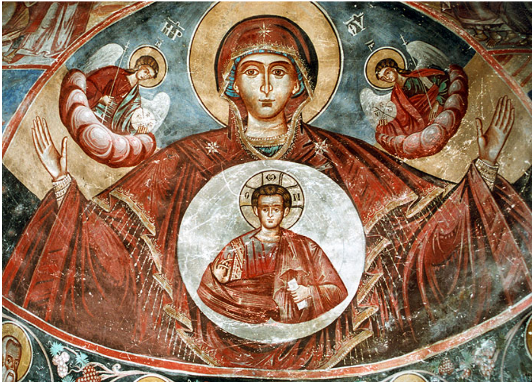
Η Πλατυτέρα. Μονή Άβελ, Βήσσανη Ιωαννίνων (1770).

Η ζωγραφική τέχνη στους Χιονιάδες ασκήθηκε στη βάση της οικογενειακής επαγγελματικής ενασχόλησης. Οι ανάγκες απαιτούσαν τα νεώτερα μέλη της οικογένειας να μαθητεύουν κοντά στους έμπειρους συγγενείς τους. Έτσι τους βοηθούσαν ασχολούμενοι με τις δευτερεύουσες εργασίες και παράλληλα μαθήτευαν κοντά τους. Ανάλογα με τον βαθμό εξέλιξής τους στη ζωγραφική, συχνά γίνονταν συνεργάτες τους και τους διαδέχονταν ή έκαναν δικά τους συνεργεία με τον ίδιο τρόπο. Οι μαθητευόμενοι ζωγράφοι ακολουθούσαν το συνεργείο των συγγενών τους από μικρή ηλικία.