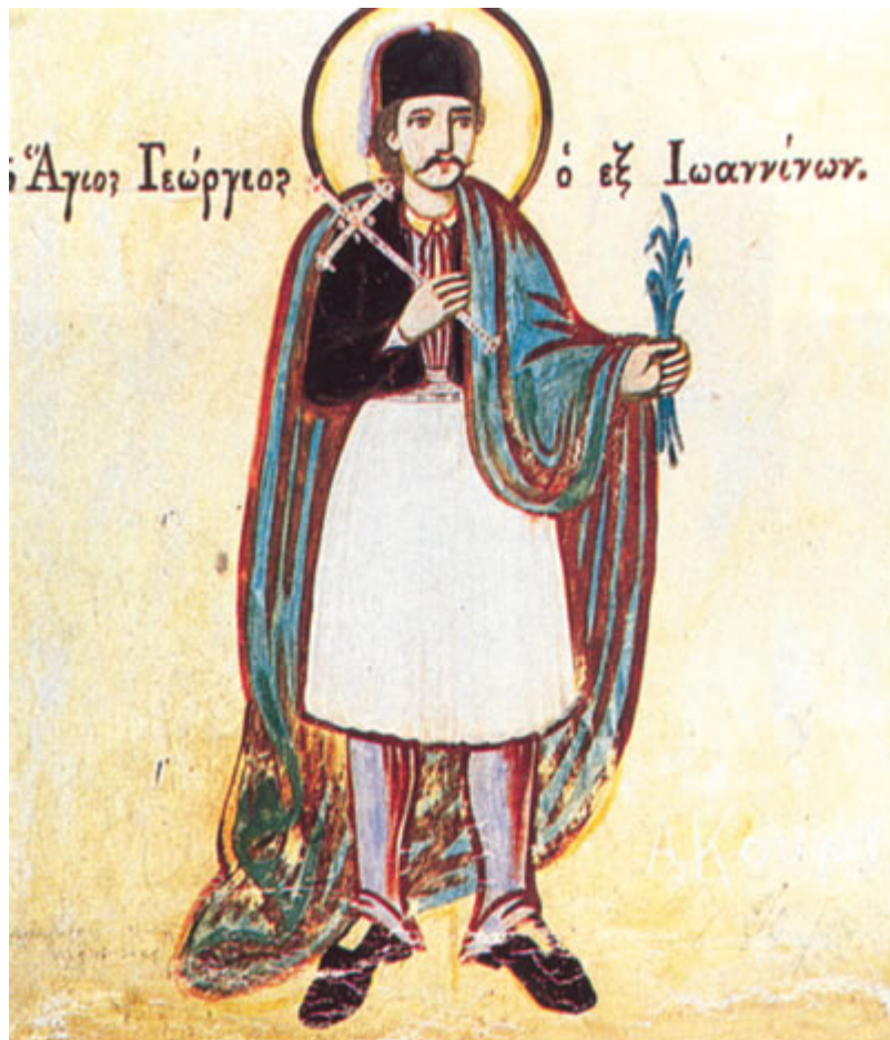
Ο Άγιος Γεώργιος ο εξ Ιωαννίνων. Τοιχογραφία του καθολικού της Μονής Αγίας Τριάδας Παλιοχωρίου Λάϊστας.

Επιγραφές αναθηματικές υπήρχαν και σε πολλά ζωγραφισμένα αρχοντικά, καθώς και σε ορισμένα ξυλόγλυπτα τέμπλα.