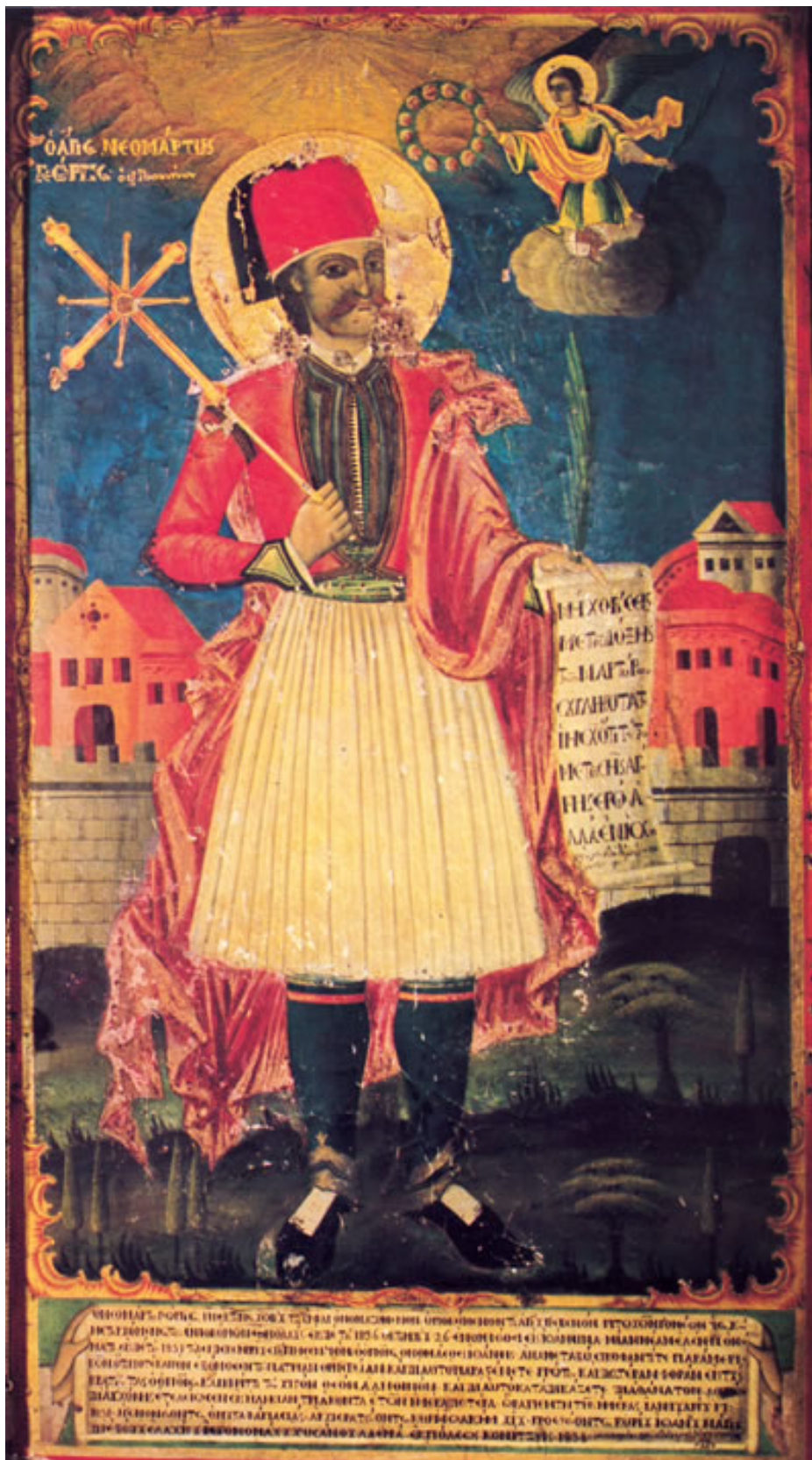
Ζήκου Μιχαήλ. «Νεομάρτυς Γεώργιος». 1838. Φορητή εικόνα στο σπίτι του Αγίου στα Γιάννενα. Ιστορήθηκε δεκατρείς μόνο μέρες μετά το μαρτυρικό θάνατο του νεαρού Ηπειρώτη ιπποκόμου, ύστερα από παραγγελία του ιερομονάχου Χρύσανθου Λαϊνά. Πηγή: Κίτσου Α. Μακρή, «Χιονιάδιτες Ζωγράφοι».