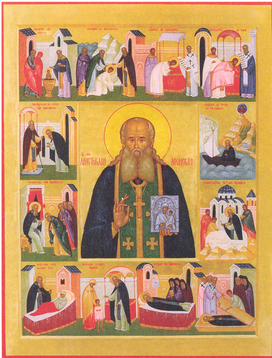
Όσιος Αριστοκλής ο Αθωνίτης. Σύγχρονη φορητή εικόνα Ι. Μ. Παντελεήμονος Μόσχας.

Ο κατά κόσμον Αλέξιος του Αλεξίου Αμβρόσιφ γεννήθηκε το 1846 στο Ορενμπούργκ των Ουραλίων. Μετά τον θάνατο της συζύγου του, το 1876, αναχώρησε για το Άγιον Όρος του Άθω, και εισήλθε στη μονή του Αγίου Παντελεήμονος.