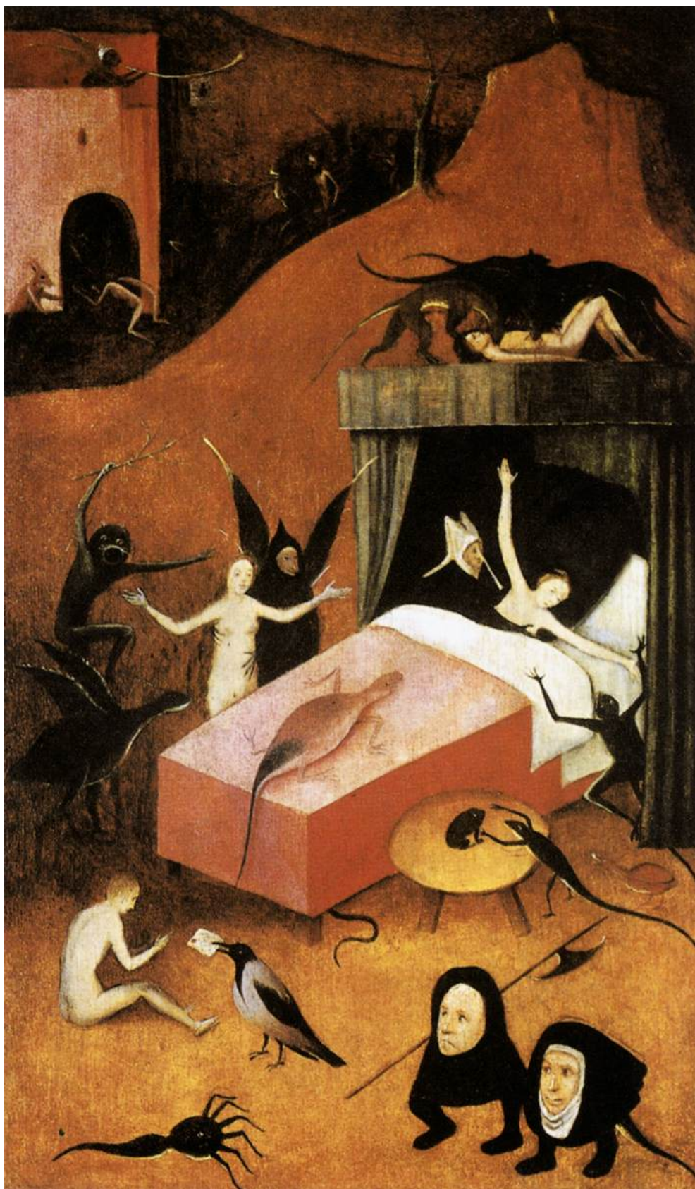
Οι δαίμονες παίρνουν την ψυχή ενός αμαρτωλού. Λεπτομέρεια από πίνακα του γερμανού ζωγράφου Hieronymus Bosch (1453-1516) που παριστάνει την Ημέρα της Κρίσεως.