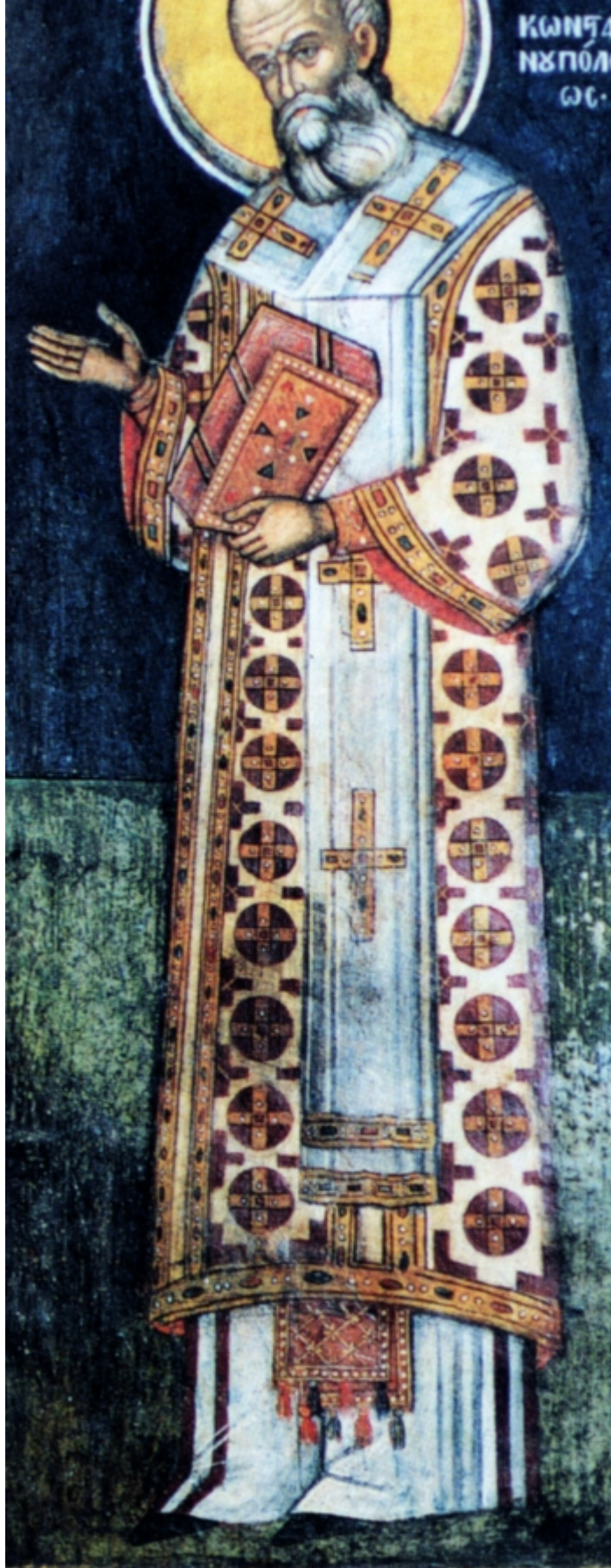
Ο κατά κόσμον Νικόλαος γεννήθηκε