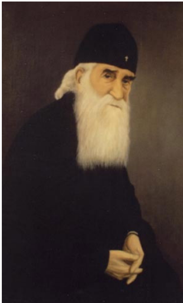
Αρχιμανδρίτη Ιουστίνου Πόποβιτς

«Εάν τις ίδη τον αδελφόν αυτού αμαρτάνοντα αμαρτίαν μη προς θάνατον, αιτήσῃ, και δώσῃ αὐτῷ ζωήν, τοῖς αμαρτάνουσι μη προς θάνατον, ἐστίν αμαρτία προς θάνατον ου περί εκείνης λέγω ἵνα ἐρωτήσῃ» (Α' Ιωάν. ε' 16).