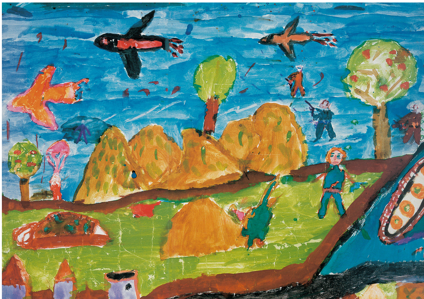
του Ιωάννη Ζαμπάρτα, Υποστράτηγου