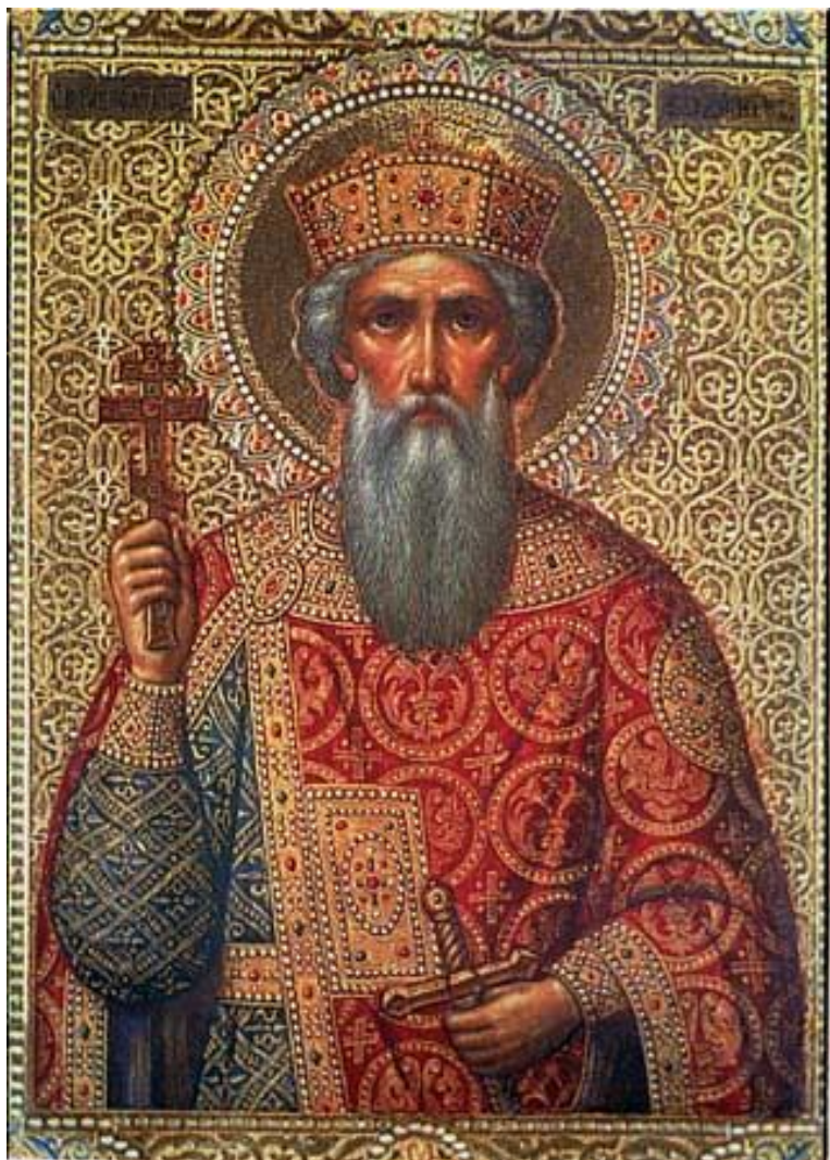
Ο άγιος Βλαδίμηρος

Ο άγιος Βλαδίμηρος (Σβιατοσλάβιτς), βαπτιστής της Ρωσίας (958-1015), ήταν ο Μεγάλος Πρίγκηπας του Κιέβου.