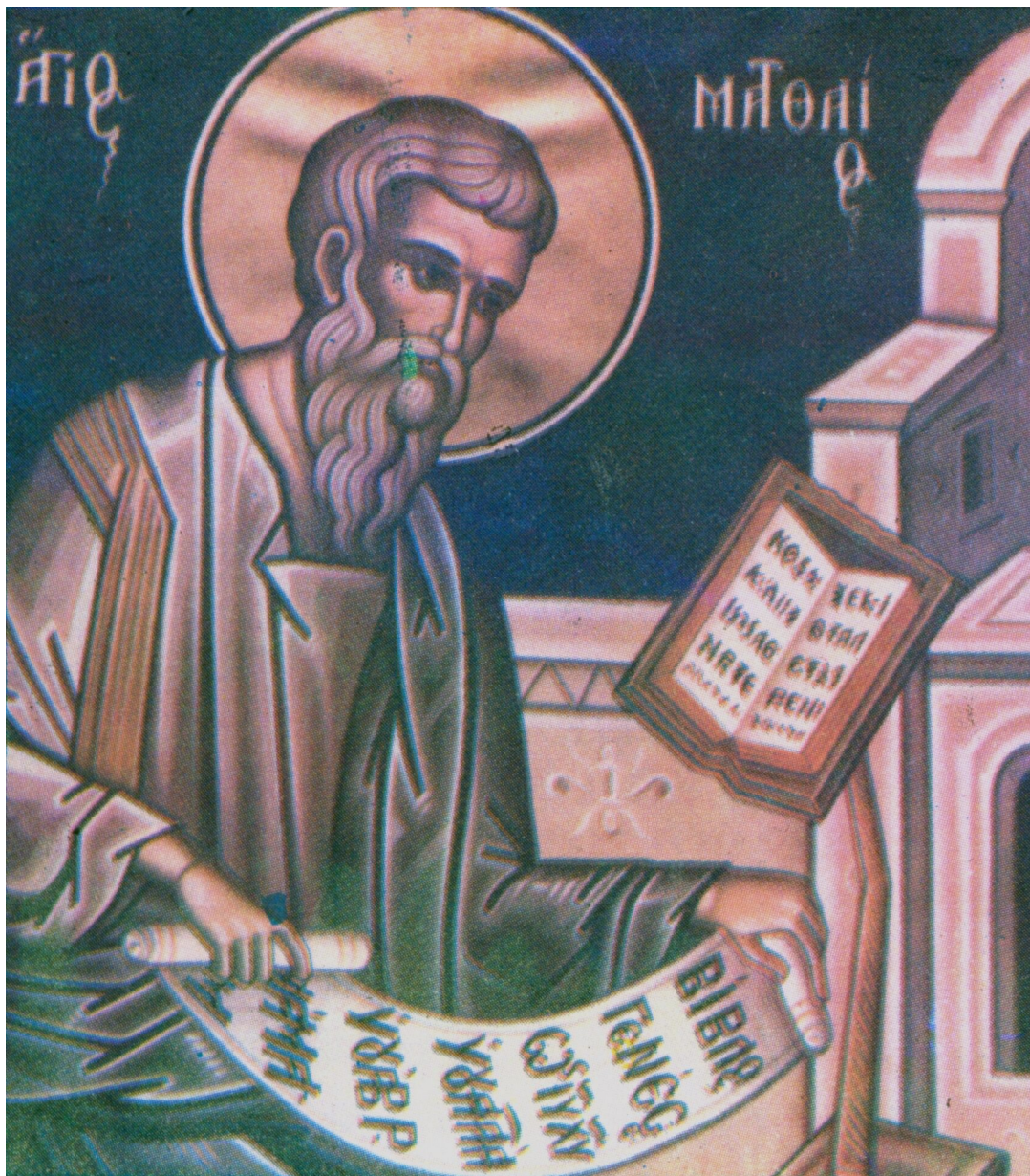
Άγιος Απόστολος και Ευαγγελιστής Ματθαίος

Στους καταλόγους των Δώδεκα μαθητών που αναγράφονται στη Καινή Διαθήκη αναφέρεται το όνομα Ματθαίος. Ο ίδιος έτσι ονομάζει τον εαυτό του στον κατάλογο των μαθητών που παραθέτει στο Ευαγγέλιο του ( Ματθ. 10, 3) αλλά και στη διήγηση της κλήσεως του στο αποστολικό αξίωμα. Στη διήγηση της κλήσεως κάνει λόγο για ένα άνθρωπο που κάθεται στο τελώνιο και γι' αυτό ο ίδιος χαρακτηρίζει τον εαυτό του «Ματθαίος ο τελώνης». Αυτός ο τελώνης στο κατά Μάρκον ευαγγέλιο ονομάζεται «Λευίς ο του Αλφαίου» ( Μαρκ. 2,14) ενώ ο Λουκάς αναφέρει μόνο « Λευίς» (Λουκ. 5, 27). Πρέπει να πούμε ότι στους καταλόγους των μαθητών αναφέρεται και ο απόστολος Ιάκωβος ως υιός του Αλφαίου, αλλά δεν ήταν αδελφός του Αποστ. Ματθαίου. Αν ήταν θα αναφερόταν μέσα στα ευαγγέλια, όπως συμβαίνει με τους άλλους αποστόλους που ήσαν αδέρφια π.χ. Ανδρέας και